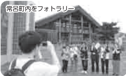
常呂町内をフォトラリー