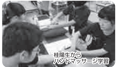
桂陽生から ハンドマッサージ学習