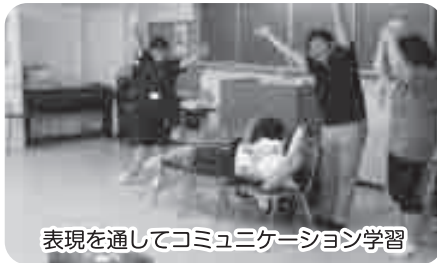
表現を通してコミュニケーション学習