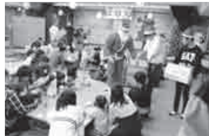
サンタさんから手作りプレゼント