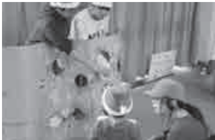
高校生の手作りゲーム