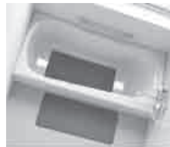
浴槽の中にも外にも設置できます。

ホームセンターやドラッグストアでも購入できます。ちょっとした工夫で安心した入浴ができて美容と健康が高まります。