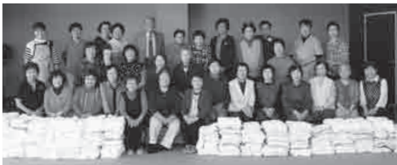
幼稚園・保育園・小学校へ雑巾寄贈

事務局：網走市老人クラブ連合会 TEL 43-2472 / FAX 43-3919 問合せ先 〒093-0061 網走市北 11 条東 1 丁目 網走市総合福祉センター内