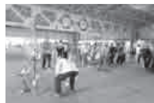
ふれあいスポーツ大会