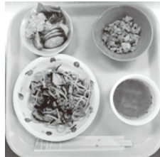
★ひじきスパゲティ ★きのこのスープ ★炒り豆腐 ★ツナサラダ