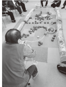
★輪っかで大漁ゲーム