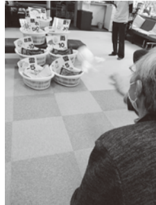
★明日天気になあれ