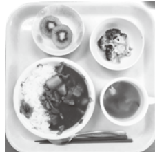
★カレーライス ★たまごスープ ★プロックリーサラダ ★フルーツ