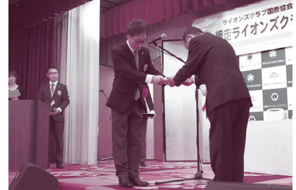
皆様から寄せられた善意が地域福祉向上のために活用させていただいております。厚くお礼申し上げます。