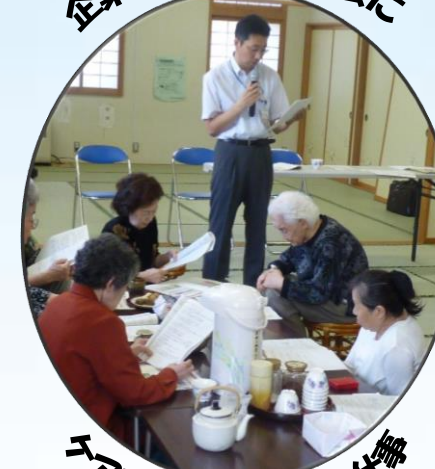
ケアマネジャーのお仕事