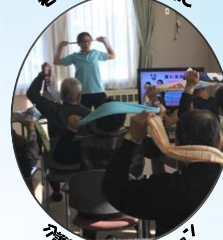
介護予防レクリエーション